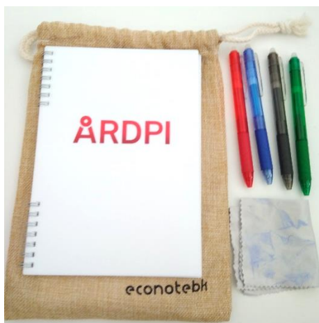
Figure 3: cahier réutilisable en papier de pierre aux couleurs d'ARDPI

Ces actions soutiennent les principes et objectifs suivants :