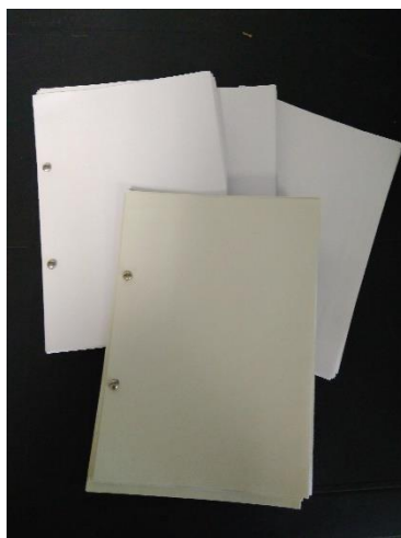
Figure 2: carnets réalisés à partir de feuilles imprimées sur le recto