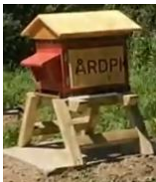
Figure 4: la ruche parrainée par ARDPI